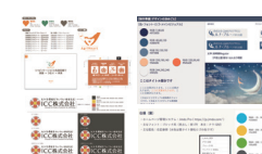
ロゴ・コーポレートカラー