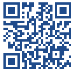
セミナー資料・ポートフォリオ等 ダウンロードページ